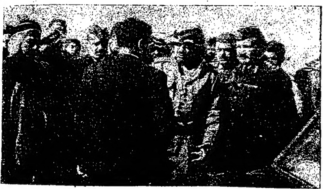
الزرقاء من ابو نوار مدير الامن العام خلال اشرافه على ضيفات الاتفاق عقب العدوان الاسرائيلي للفكر على قرية كثر اسد

تعلن رئاسة اركان الجيش العربي - محبوبة الخدمات الطبية الملكية من افتتاح باب التسجيل في مدرسة تلميذات مساعدات التمريض في المستشفى الرئيسي . مدة الدراسة ( ١٨ ) شهرا وتعين الطالبات براتب ورتبة جندي نظمي وتكون باللمس والسكن والملكل وعند التخرج بنجاح تعطى علاوة شهرية ثلاثة فئاتير . الشروط القبول : 1 - ان تكون اردنية الجنسية 2 - ان لا يتل مرها من ١٧ عامولا يزيد من ٢٥ 3 - ان تكون قد اتمت دراسة الصف الثالث اعدادي بنجاح على الراغبات في الانتساب مراجعة بحرية التمريض في مديرية الخدمات الطبية الملكية في ايام السبت والثلاثاء والاربعاء ما بين الساعة الثامنة صباحا حتى الواحدة ظهرا مستصحيات بمعن الوثائق التالية : 1 - جواز السفر 2 - شهادة البرلاد 3 - الشهادة الحرسية على ان تكون مصنعة من وزارة التربية والتعليم واية اوراق وشهادات ثبوتية اخرى .